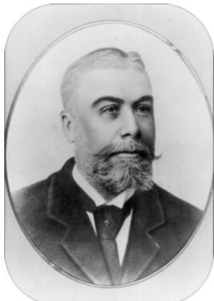
Portret van Gustaaf Botelberge.