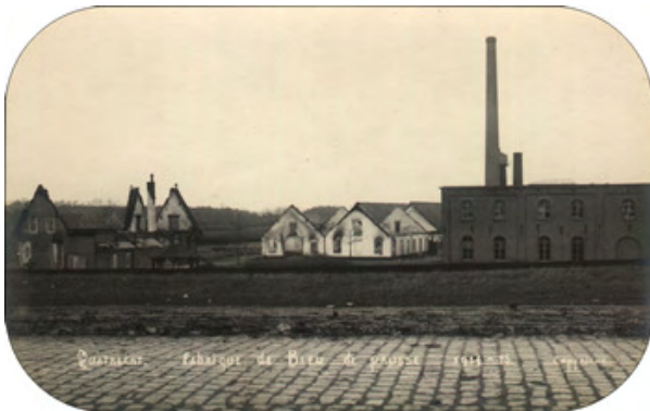
De blauwfabriek na de verwoestende gevechten op 7 september 1914 tegen de oprukkende Duitse legertroepen.