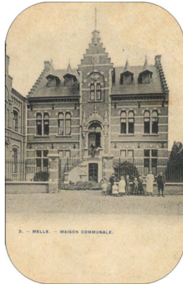
Het oud-gemeentehuis langs de Brusselsesteenweg.