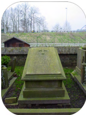
Grafmonument van de familie Botelberge-Verriest.