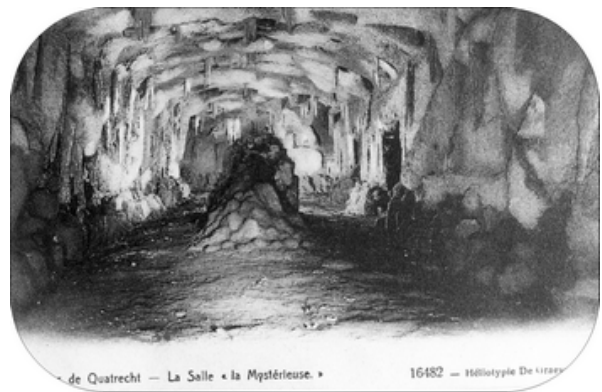
De grotten van Kwatrecht.